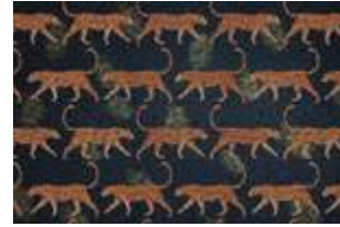
25 Walking Leopard p.70