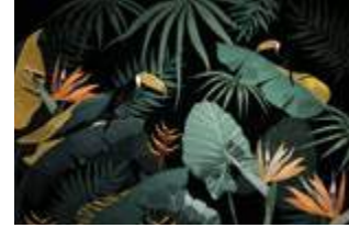
18 Jungle dream p.56