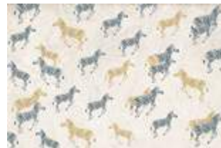
27 Zebra pattern p.74