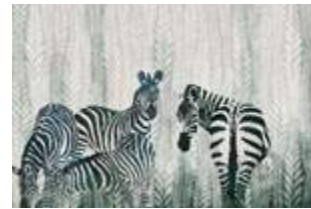
26 Zebre p.72