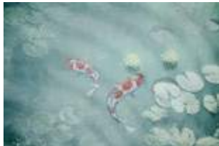
02 Koi p.18