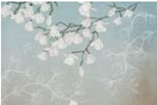
11 Spring p.40