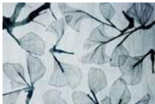
06 Nature Poem p.30