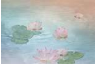
10 Loto p.38