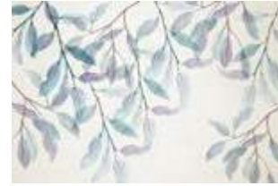
07 Peace p.32