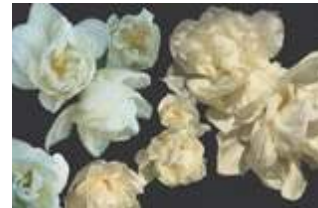
17 Blanche p.52