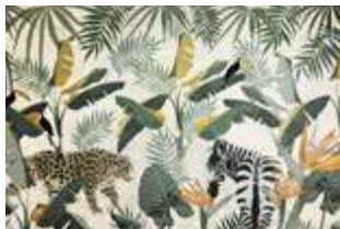
21 Into the wild p.62