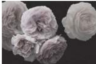
14 Rose p.46