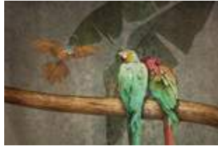
22 Parrots p.64