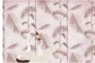
13 Palms and birds p.44