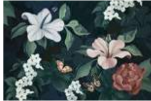
04 My fantasy garden p.24