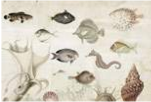
01 Aquarium p.16