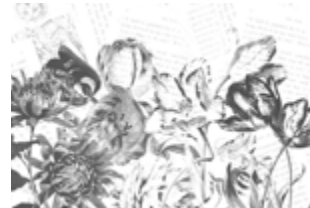
08 Alice's flowers p.34