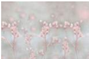
12 Silence p.42