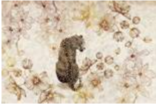
19 Orchid p.58