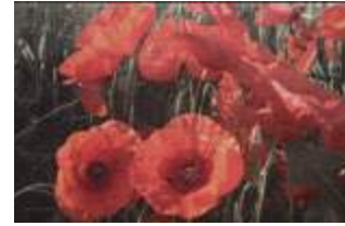
16 Poppies p.50