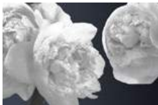
15 Instant God p.48