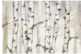
09 Trees p.36