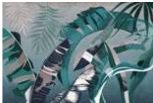
23 Jungla 2.0 p.66