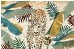
24 Leopard p.68