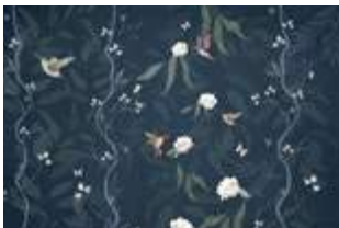
03 Fairytale p.20