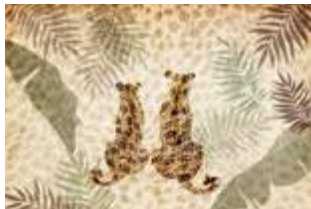
20 Our moment p.60